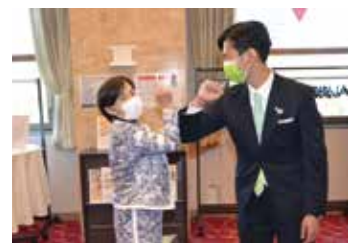
カミヤタッチでご挨拶させていただいています

られる視線も変わってきているようにも感じます。そのように様々なことが変わり、新しい生活様式も求められる中、全国の皆様にご挨拶する機会を得られるようにWEB画面を通じたリモート形式もフルに活用して取り組んでいます。