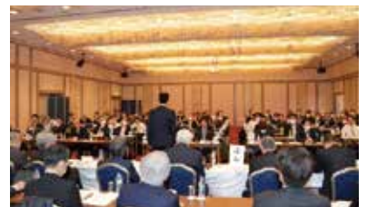
令和元年度日本薬剤師連盟定時評議員会にて組織内統一候補に決定いただきました

その時の決意は、2020年4月POWER号外に掲載されていますが、薬局の息子として幼い頃から触れてきた「薬剤師が薬局や医療機関でその職能を十分に発揮することは地域住民の健康増進や公衆衛生の更なる向上、社会保障制度の維持にも貢献できる」という想いや、製薬