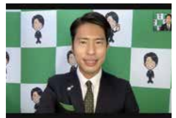
リモート形式でのやり取りもフル活用しています

そのための方法も、時代や社会の流れを上手く乗りこなしていく必要もあるかもしれない。ちょうど組織内統一候補に選任をいただく前後から、新型コロナウイルス感染症拡大により様々な価値観が一変しました。私たち薬剤師はその中でも医薬品提供体制を崩すことなく、公衆衛生