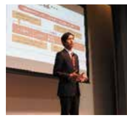
地元豊橋で社会保障と薬剤師について講演をした時の様子

薬剤師の未来のために、政治力も必要だ。その一念から、平成28年第24回参議院議員通常選挙(藤井選挙)では地元豊橋に