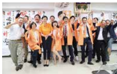
日本薬剤師連盟企画実行委員会メンバーとの歓喜の笑顔

に広い視野で政治に触れるきっかけとなりました。そのように政治に対する熱が高まった状態で、関わったのが日本薬剤師連盟企画実行委員会としての本田あきこ先生の後援会活動でした。様々な議論を真剣に交わし、共に汗を流して励まし合った実行委員会メンバーと共に迎えた令和元年(平成31年)7月の第25回参議院議員通常選挙の投票日、明け方に当確が出た歓喜の瞬間のことは現在も鮮明に覚えています。