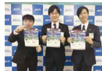
担当例会をプレスリリースした際、理事長と担当副理事長と一緒に

において、その重要性を懸命に訴え続けました。その結果、豊橋の連盟活動に対する意識が大きい