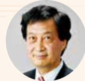
薬剤師・薬学博士 前文部科学副大臣・参議院議員 藤井もとゆき