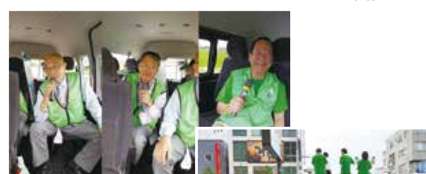
北陸・信越ブロック